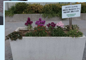
●やさい広場の緑化プランター