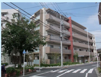
●京島三丁目地区防災街区整備事業 (京島三丁目8番周辺)

1) 緑地整備 24箇所 2) 雨水ポンプ等 (地区外2箇所含む) 15箇所 166.2トン 3) 防火用タンク 3箇所 7トン 4) 集会所 2箇所