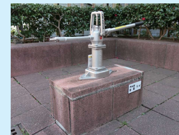
●新しくなったさくら一休の雨水ポンプ