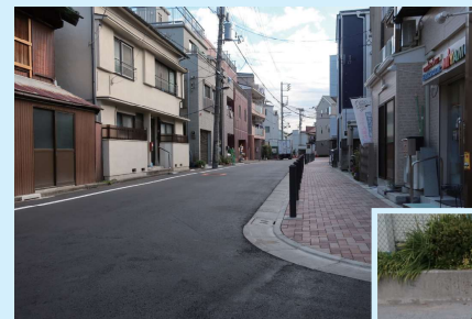
●京島二丁目15番からみた4号線