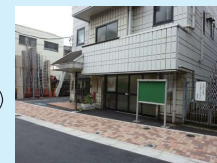
●京島事務所 (京島会館1階) 「通称:京島まちづくりの駅」 (京島二丁目15番5号)