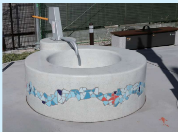
●協和井戸端広場の防災井戸 (京島二丁目26番)