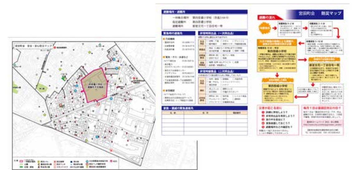
▲安全・安心防災マップ

今回の更新では、消火器の配置場所、簡易消化機材(ハリアー)の設置場所、防災倉庫・ベンチの鍵所有者宅、緊急時水提供宅の場所、AEDの設置場所、見守り対象者の確認を行いました。