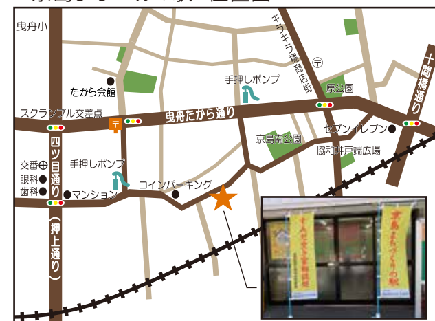
■京島まちづくりの駅 位置図

京島まちづくりの駅(墨田まちづくり公社京島事務所) 〒131-0046 墨田区京島二丁目15番5号 京島会館1階 Tel:03-3617-2262 FAX:03-3616-8916