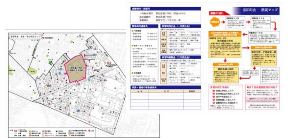
▲安全・安心防災マップ