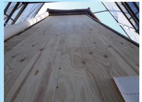
外壁を構造用合板で補強