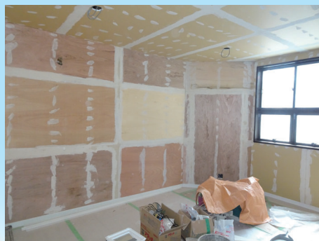
室内壁を構造用合板で補強