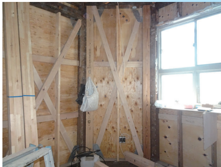
筋交いと金物で補強