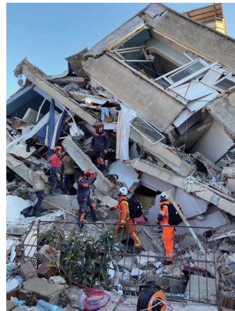
© 2023 Foreign, Commonwealth & Development Office