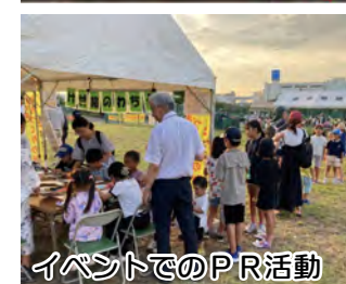
イベントでのPR活動