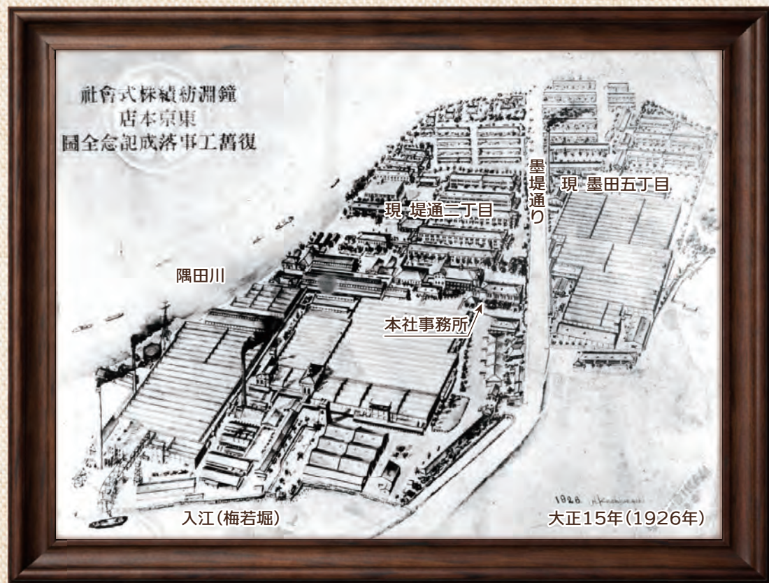
関東大震災後の「復舊(旧)工事落成記念全圖(図)」(大正15年) <資料提供:すみだ郷土文化資料館>

・図のほぼ中央に本社事務所があり、上方(北側)に社宅が並び、下方には工場群、さらに入江(梅若堀)には船がみえます。