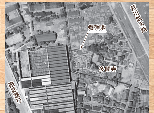
昭和22年撮影の写真

周辺には工場の従業員を相手に、酒屋・お菓子屋などの商店が並んでいたということでした。