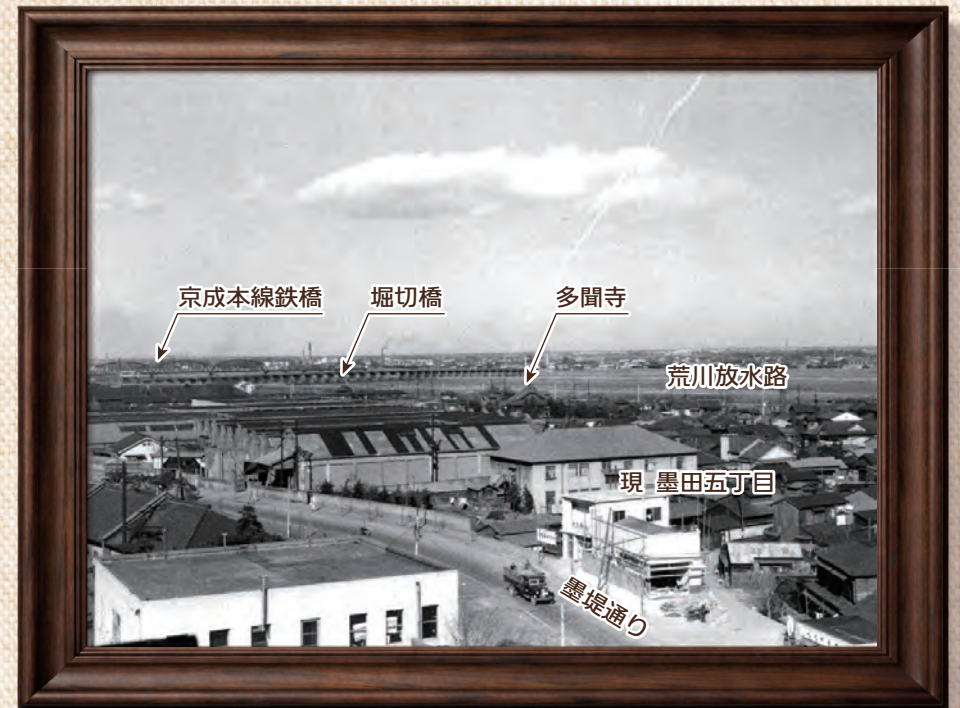
昭和33~34年撮影の写真