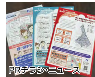
PRチラシ・ニュース

あわせて、フェイスブックを活用して、鐘ヶ淵関連の様々なニュースや出来事を定期的に発信し、情報提供を行っています。