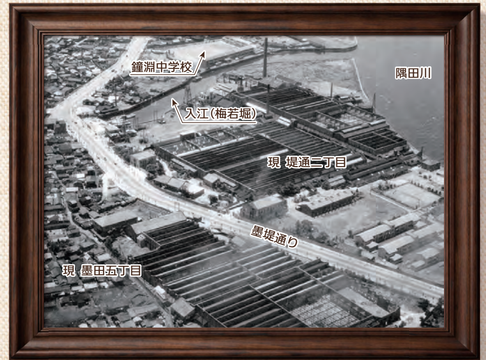
昭和29年撮影の航空写真

・向島消防署隅田出張所(現位置とは異なり、堤通二丁目側にあった)の望楼から撮影された写真です。現在の墨田五丁目側の工場群がよくわかります。